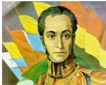
Papá Bolívar en La Gran Colombia

Logotipo Proyecto Papá Bolívar en La Gran Colombia