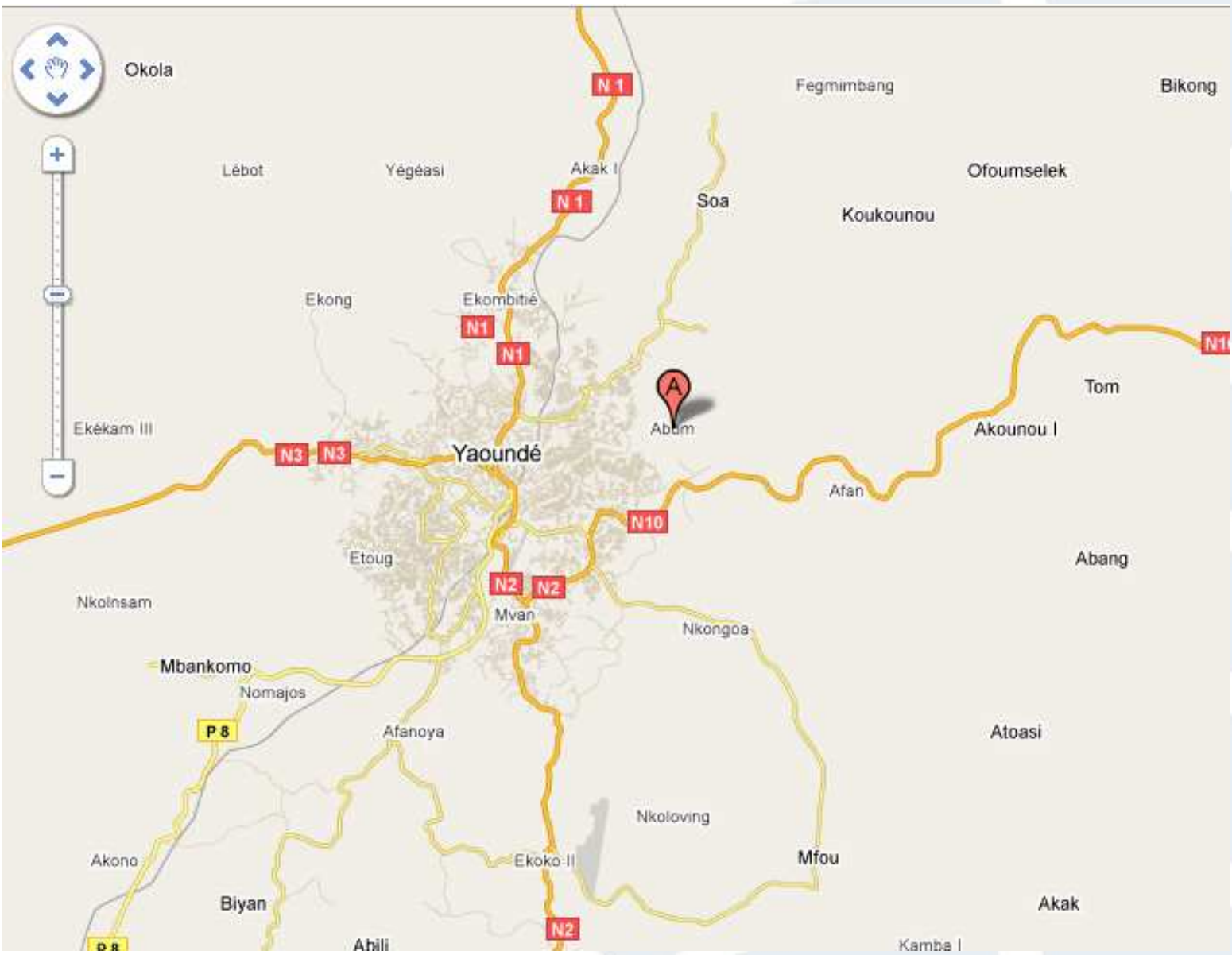
Localización de Abom