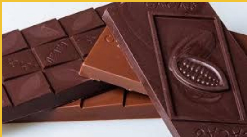
Foto de Salt del Colom.