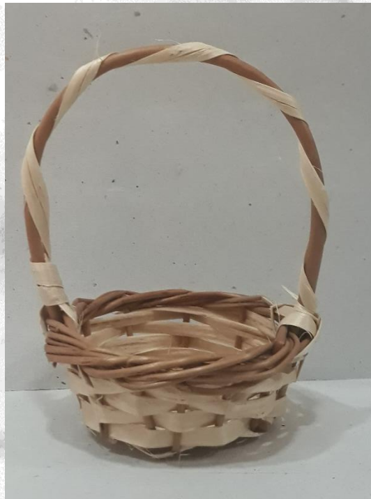
1) precio: 1,50€ 15 gr