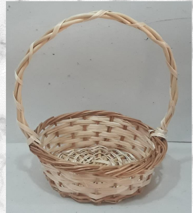
3) precio: 3,00€ 75 gr