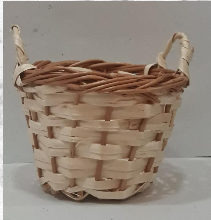
2) precio: 2,50 € 35 gr