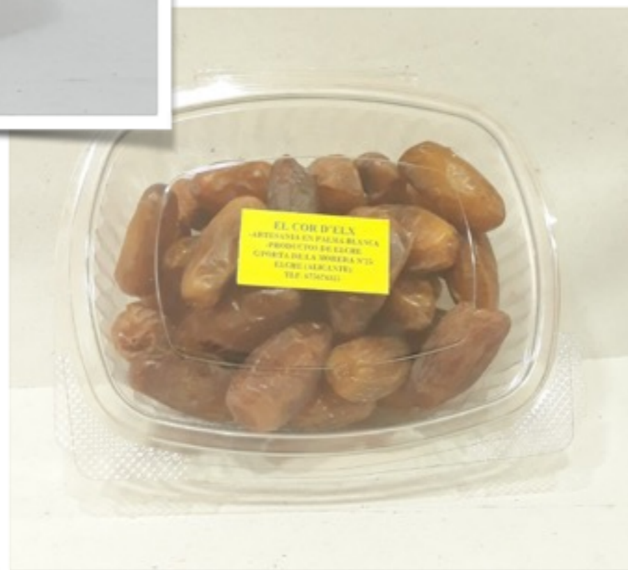
Tarrina de dátils 300g