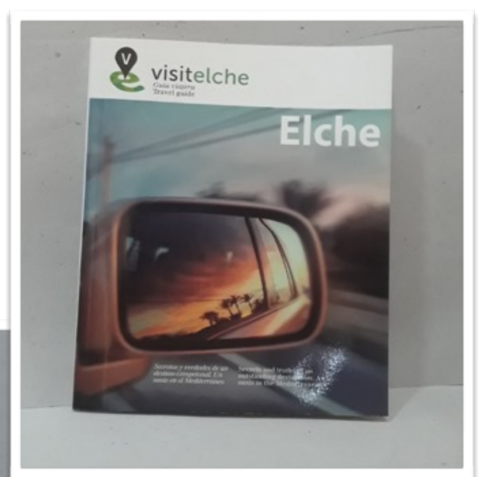
Guía "Visitelche" 260g