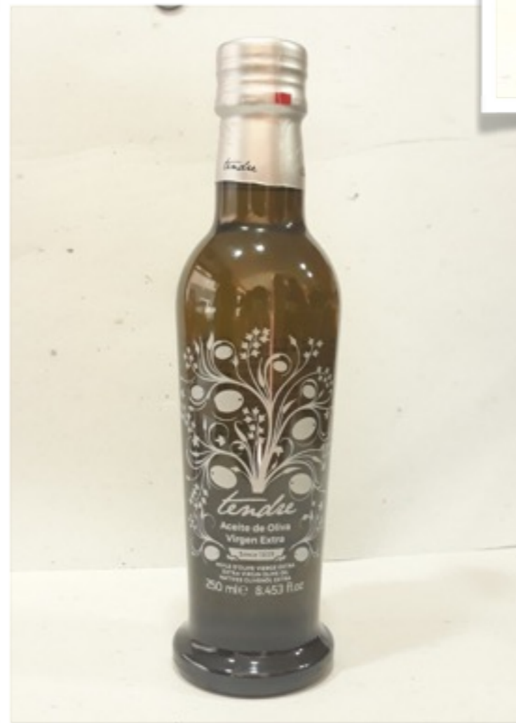
Aceite de oliva virgen "Tendre" 525g