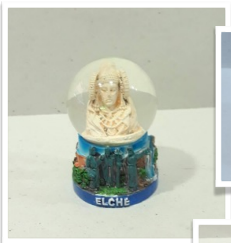
Bola de cristal con Dama de Elche 100g