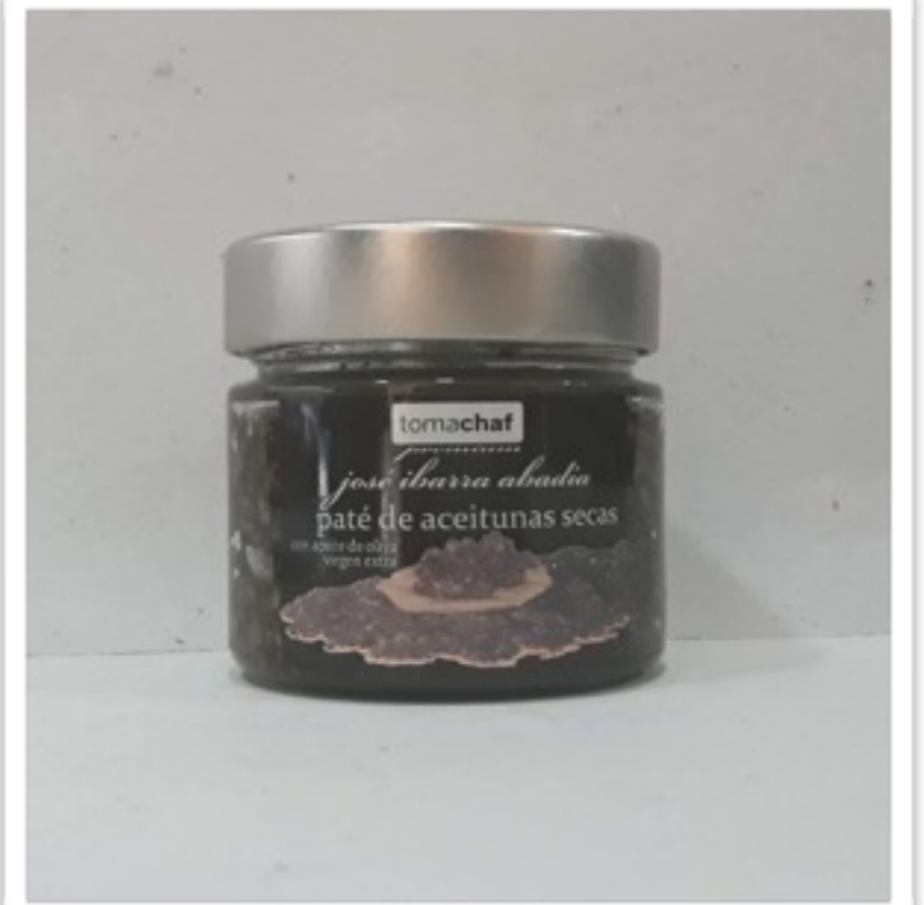
Paté de aceitunas secas "Tomachaf" 300g