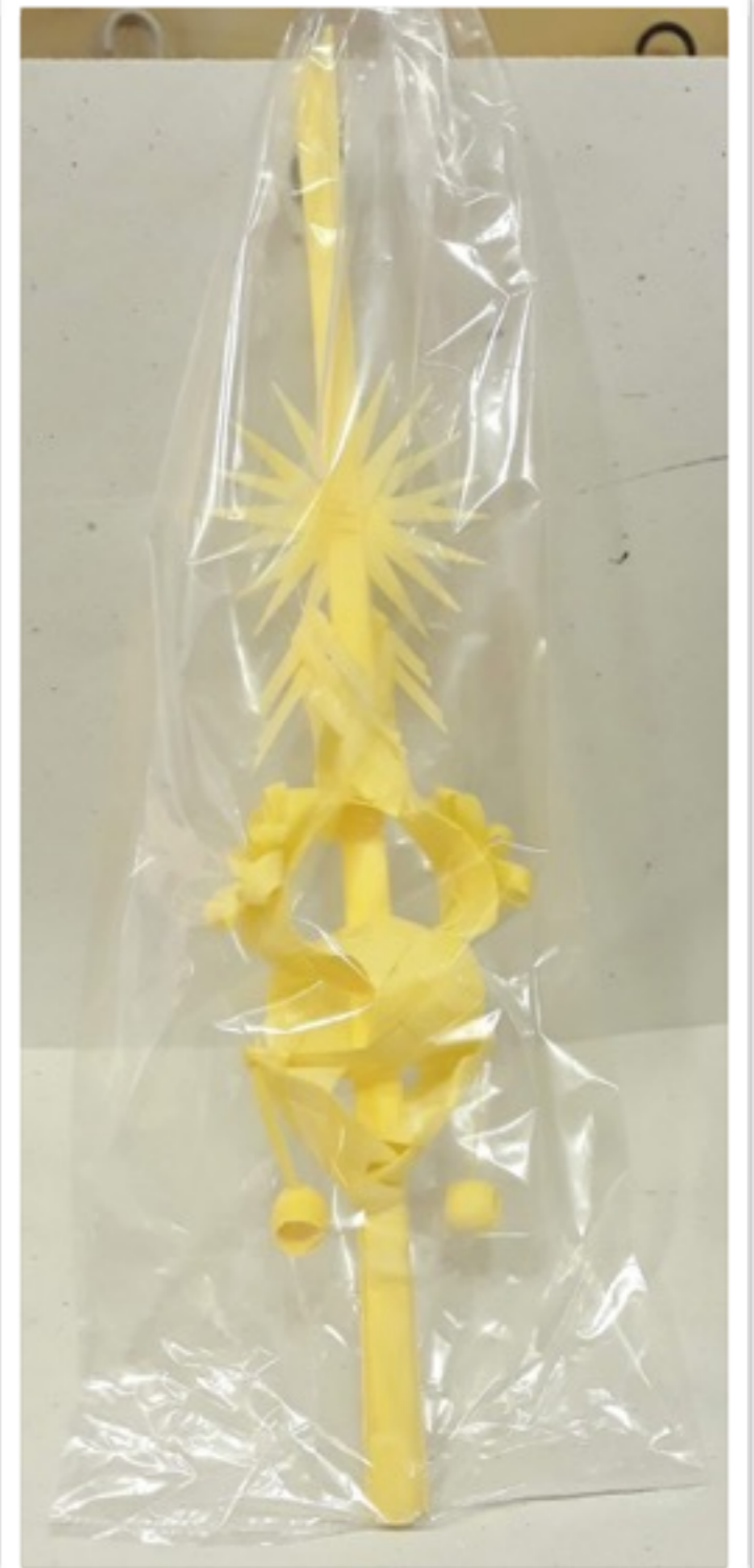
Palma rizada 50g