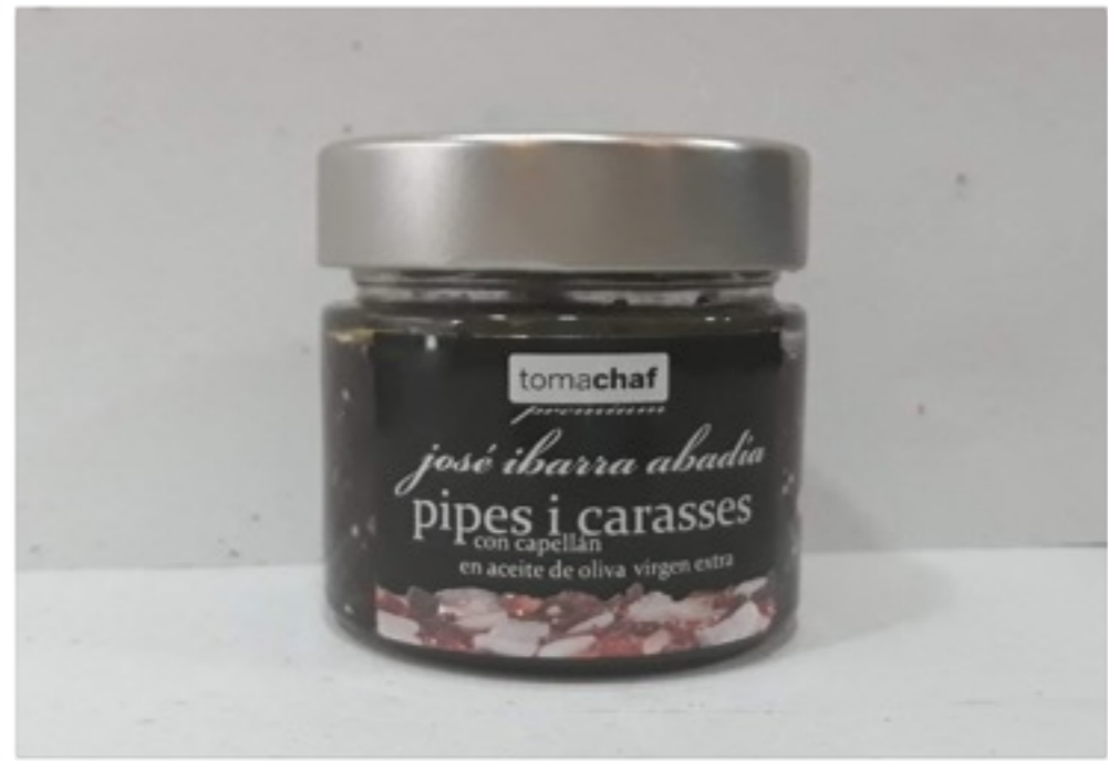
Paté de pipes i carasses "Tomachaf" 300g