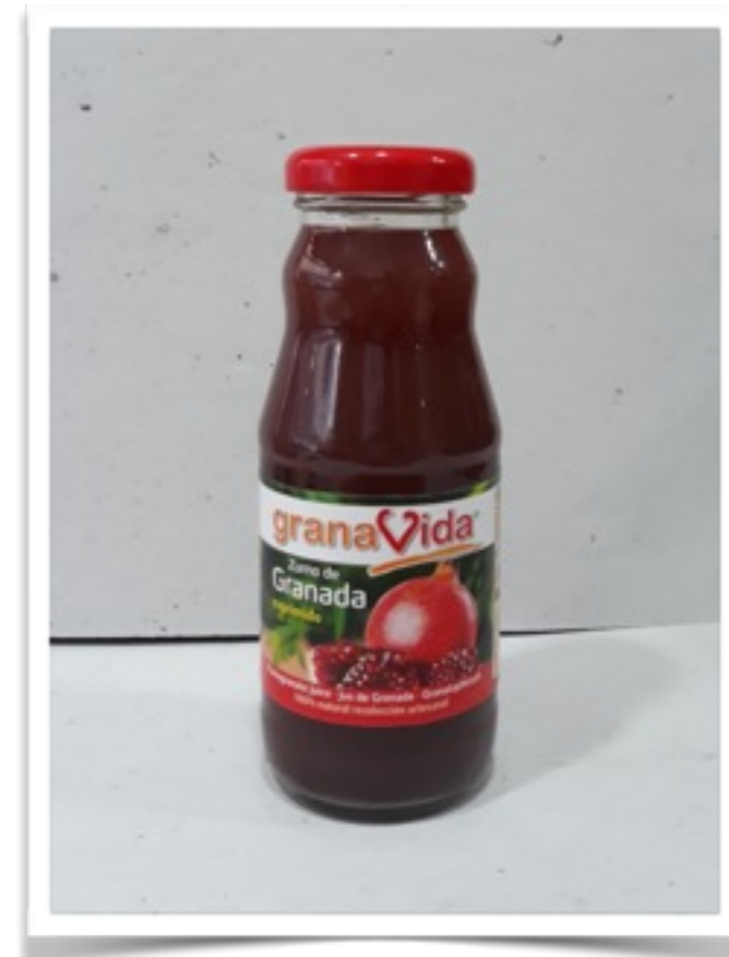
Zumo de granada 360g