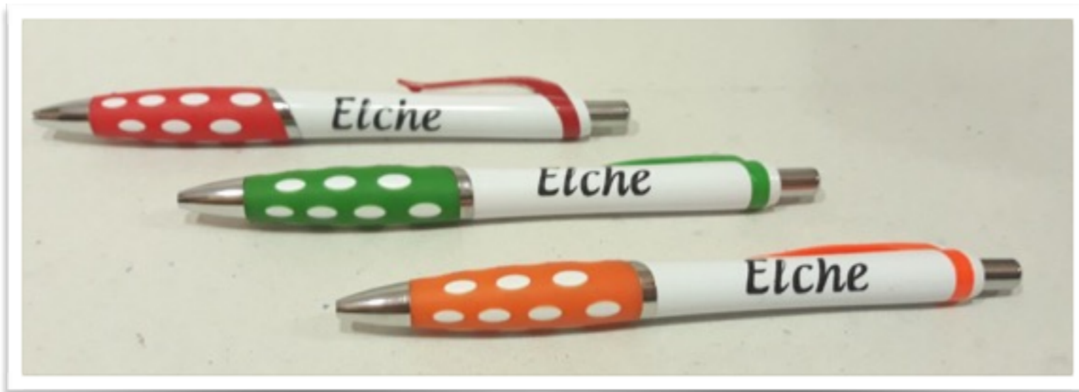
Bolígrafo Elche diferentes colores 10g