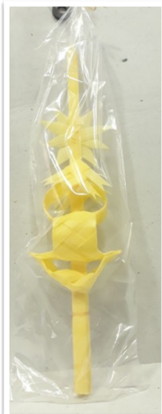
Palma rizada pequeña 25cm