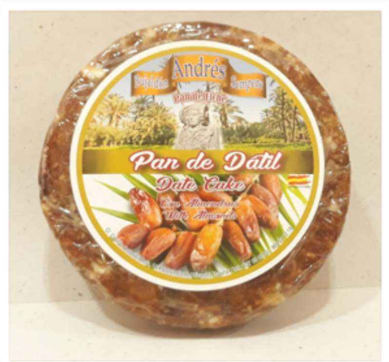
Pan de dátil con almendras 250g