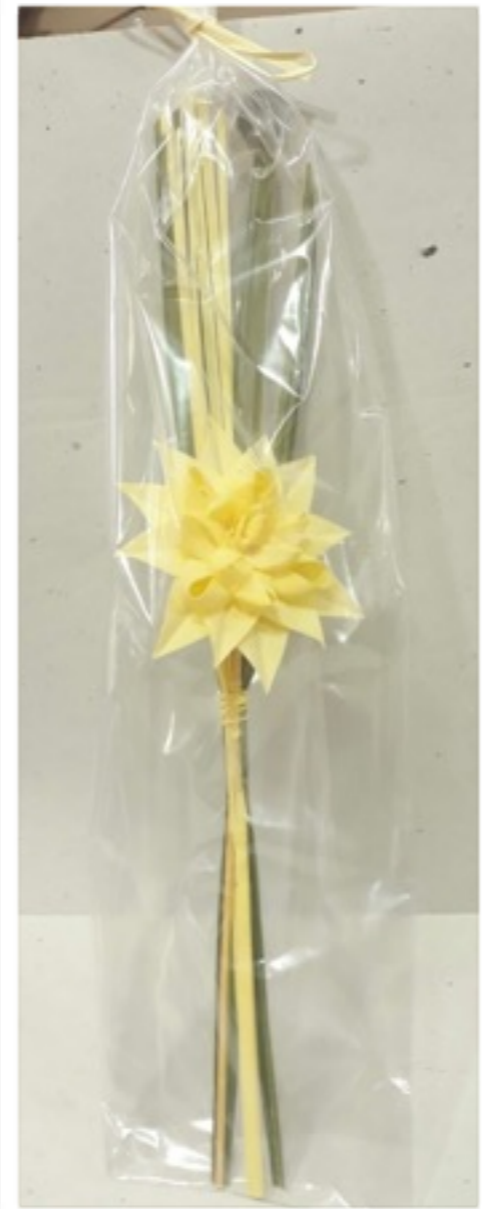
Detalle flor palma verde 35cm