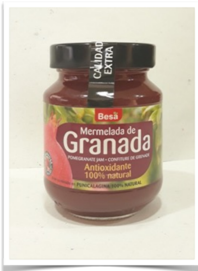
Mermelada de granada 500g