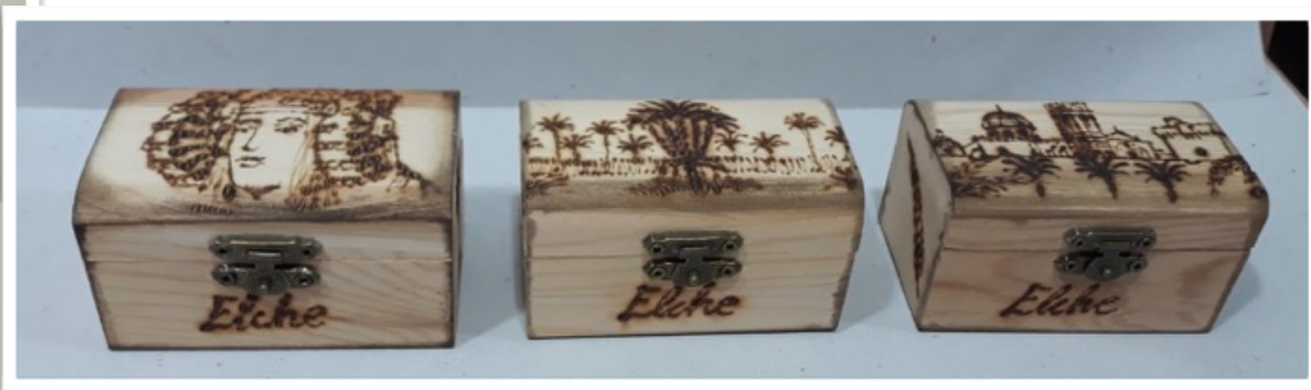
Cajas de madera, joyero 60g