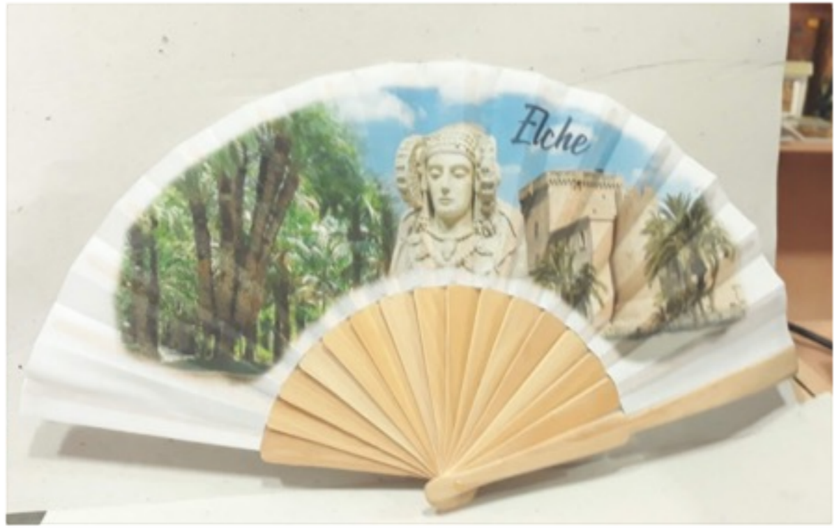
Abanico "distintas vistas"