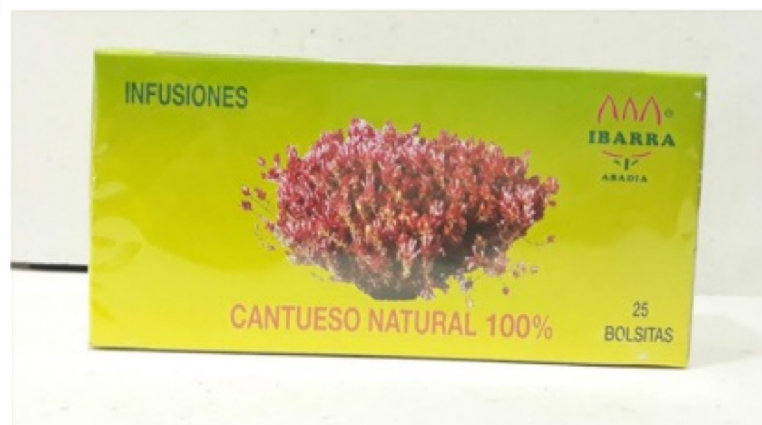
Infusión de cantueso 25 unidades