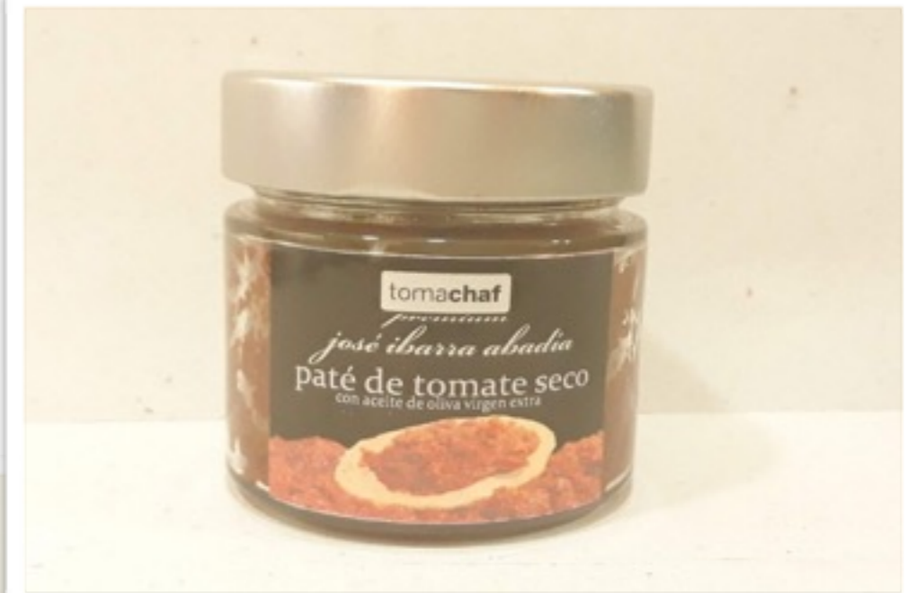
Paté de tomate seco "Tomachaf" 300g