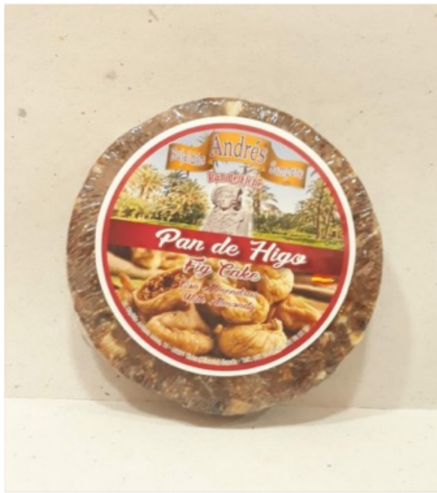
Pan de higo con almendras 250g