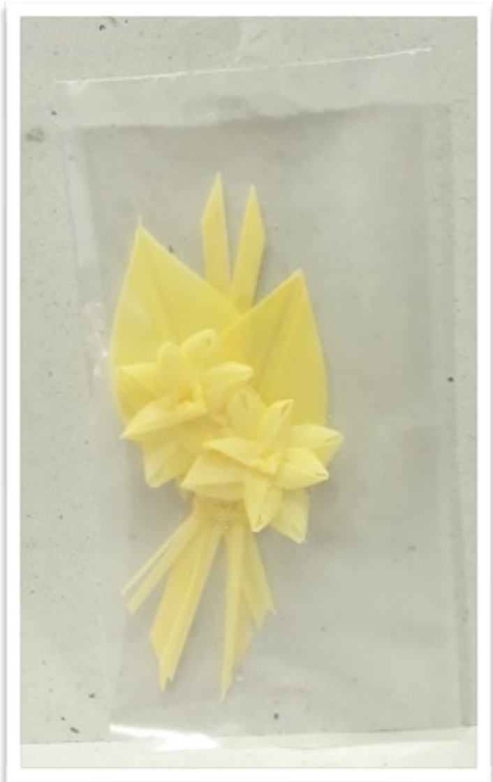
Palma pin 10 cm