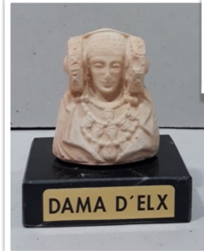
Figura Dama de Elche pie de mármol 200g