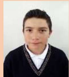
JAIVER JIMENEZ PRODUCCIÓN