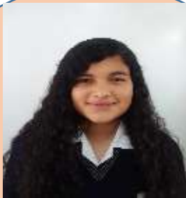
ILCEN MURILLO CONTABILIDAD