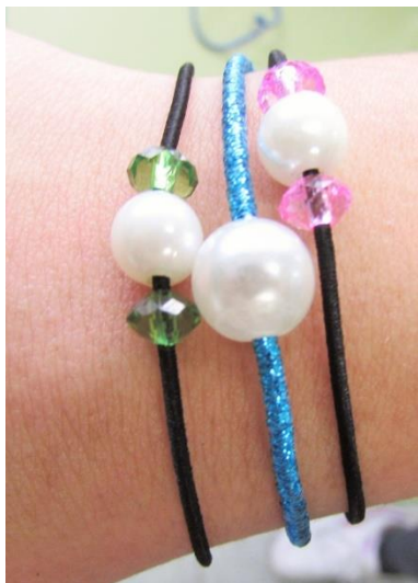
Coleteros con abalorios