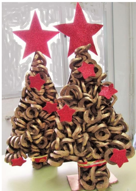
Árbol de navidad (por encargo)