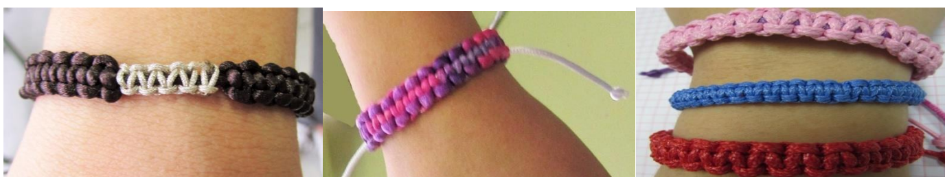
Pulsera de cuerda en diferentes colores