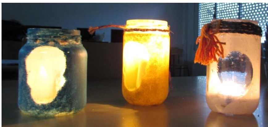
De tarros pintados