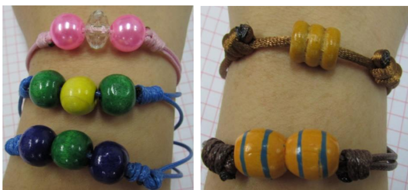
Pulsera con bolas de madera en diferentes modelos ref. 2002