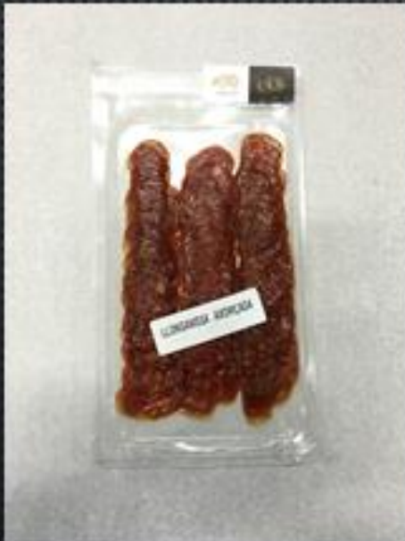
LONGANIZA ACHORIZADA LLESCADA → 3€