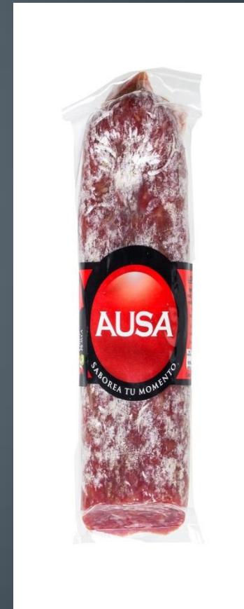
MITAD DE LONGANIZA → 11€/Kg 235 gr