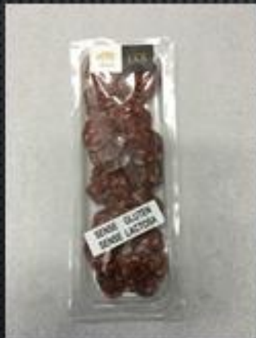
SOMALLA RURAL LLESCADA → 2,50€