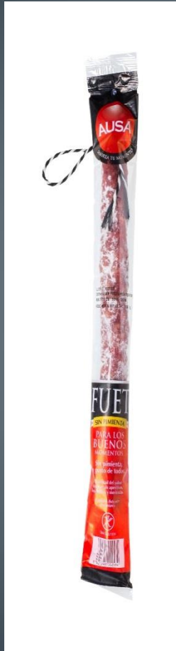
FUET SIN PIMIENTA → 2€ 180 gr