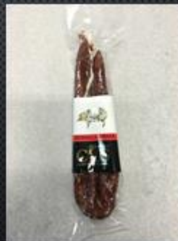
SOMALLA → 3€