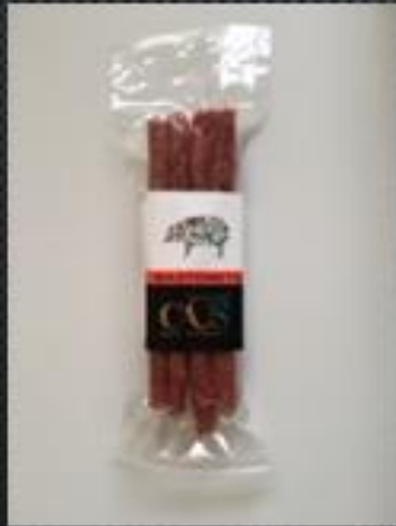
BASTONCITOS DE LONGANIZA →