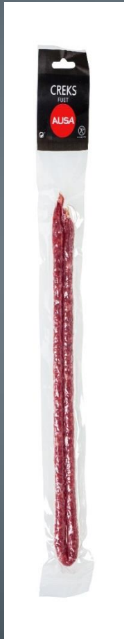
CREKS DE CHORIZO → 2€ 100 gr