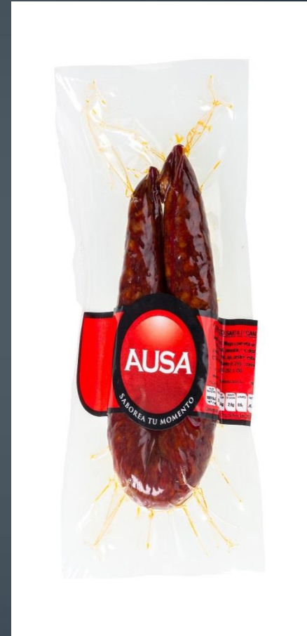
CHORIZO SARTA PICANTE → 2,50€ 200 gr