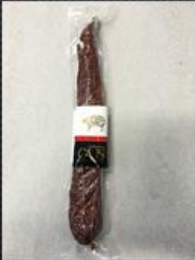
SECALLONA → 3,25€