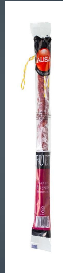
FUET → 2€ 200 gr