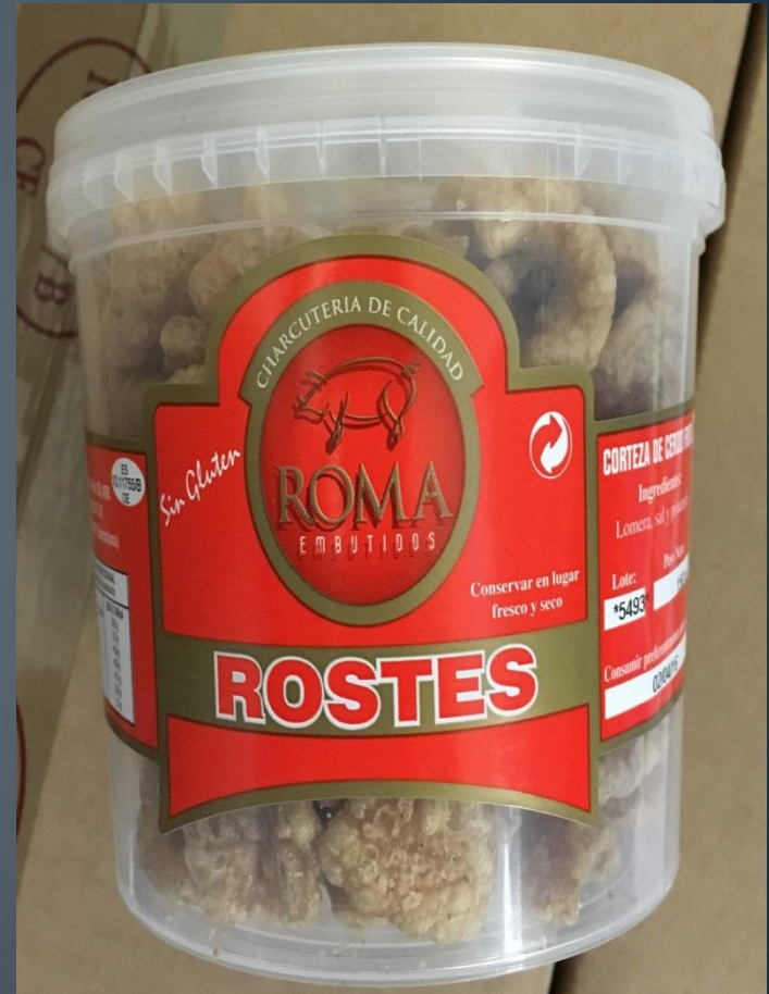
CORTAZAS → 2,50€ 150 gr