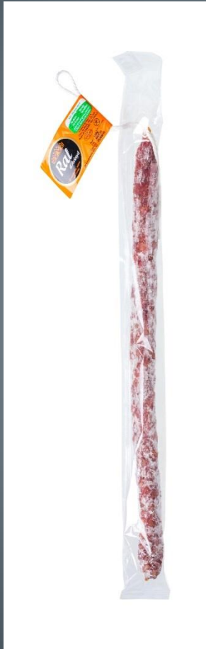
LONGANIZA SIN ALERGENOS → 3€ 275 gr