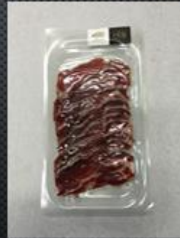
CABEZA DE LOMOSECO →