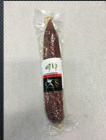
LONGANIZA DE PAYÉS → 3€