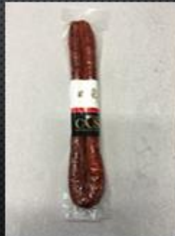
CHISTORRA → 3€