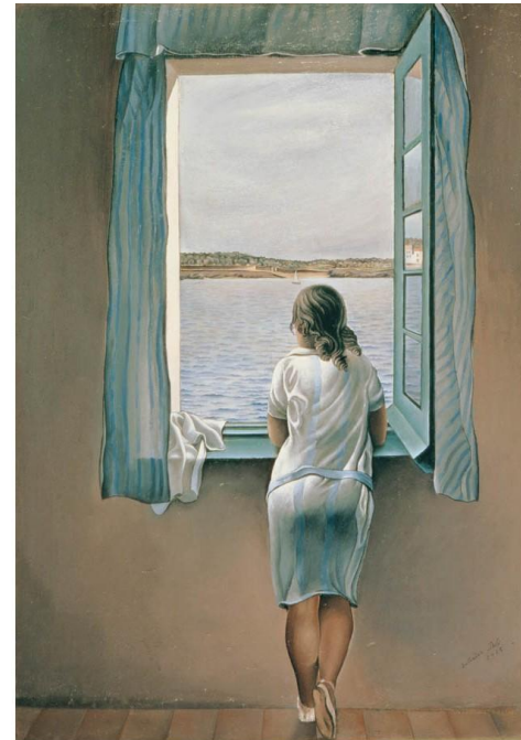
SALVADOR DALÍ FIGUERES

Edición limitada de 100 ejemplares en 2019