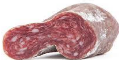
La más típica