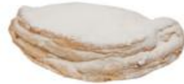
EMPANADILLAS DE CABELLO