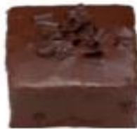
BIZCOCHO DE YOGUR