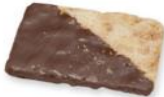
GALLETAS HOJALDRADAS CON CHOCOLATE