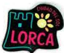
IMÁN FLEXIBLE - 2,00 €