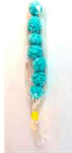
BOLSA DE CHOCHOS BLANCOS O AZULES - 2,00€ / UNIDAD