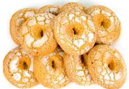
ROLLOS DE ANÍS 3,00€ / DECENA