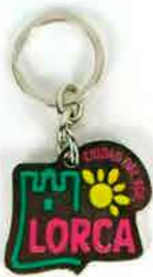
LLAVERO METAL - 4,00 €