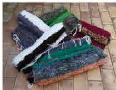
JARAPA 70 x 70 CM - 10 € 70 x 130 - 22 € 120 x 160 - 30 € 140 x 200 - 35 € 170 x 240 - 45 €