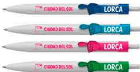
BOLÍGRAFO - 2 €