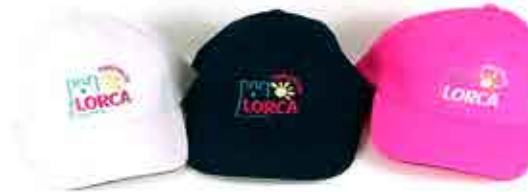
GORRA - 6,00 €