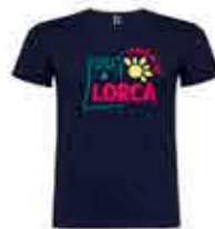
CAMISETA 100% ALGODÓN - ADULTO : 10 € - NIÑO: 8 €