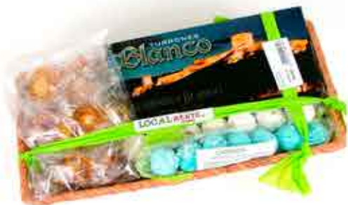
LOTE DULCES LORQUINOS - 12,00€ INCLUYE CANASTILLA CON PASTILLA DE TURRÓN DE ALMENDRA BLANDO, PICARDÍAS, CHOCHOS BLANCOS Y AZULES Y POSTAL