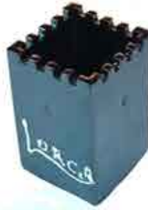
LAPICERO TORRE CASTILLO DE LORCA 11 x 8 CM - 10 €