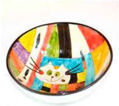
CUENCO DE DESAYUNO - 10 € 16 CM DIÁMETRO Y 8 CM DE FONDO