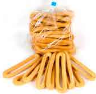
ROSQUILLAS NORMALES O INTEGRALES - 2,00€