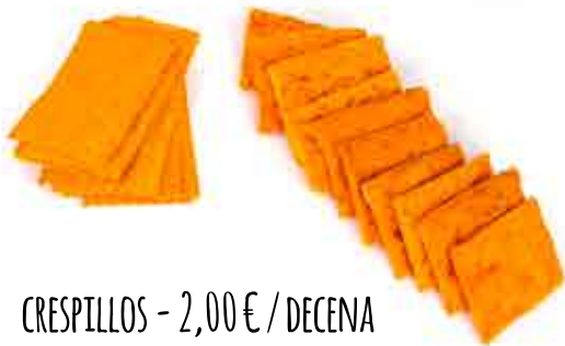
CRESPILLOS - 2,00€ / DECENA