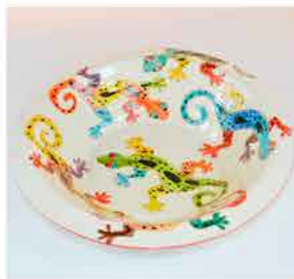
LEBRILLO - 25 € 28 CM DE DIÁMETRO Y 8 CM DE FONDO