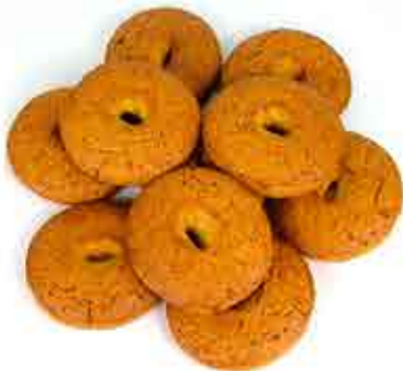
ROLLOS DE NARANJA - 3,00€ / DECENA