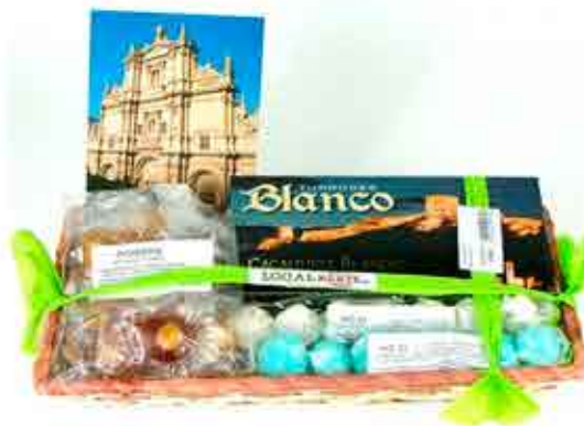
LOTE DULCES LORQUINOS - 11,00€ INCLUYE CANASTILLA CON PASTILLA DE TURRÓN DE CACAHUETE BLANDO, PICARDÍAS, CHOCHOS BLANCOS Y AZULES Y POSTAL