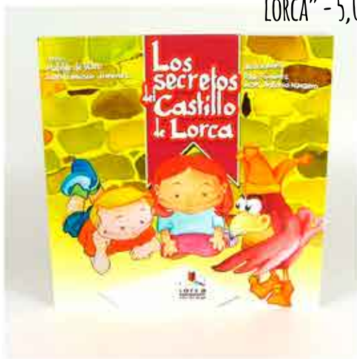
LIBRO INFANTIL "LOS SECRETOS DEL CASTILLO DE LORCA" - 5,00 €