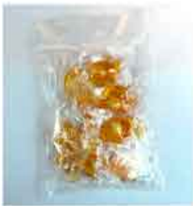
BOLSA DE PICARDÍAS - 3,00€