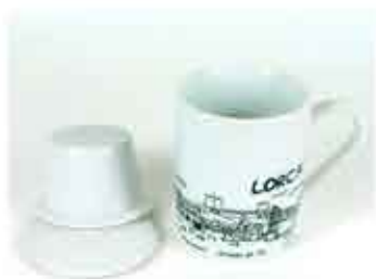
TAZA TISANA - 10 €