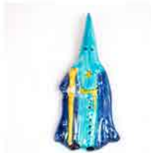
IMÁN - 10 x 5 CM 4,00 €