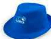
SOMBRERO - 6 €