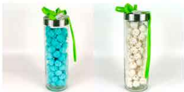
TARRO DE CHOCHOS BLANCOS O AZULES DE 1 KG 19,00€