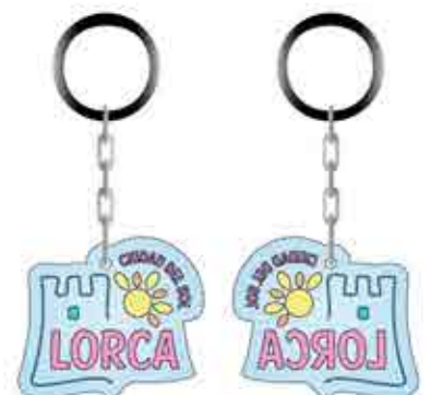
LLAVERO METACRILATO - 3,00 €