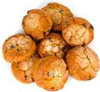
TORTAS DE NARANJA Y CHOCOLATE 3,00€/8 UDS