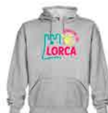
SUDADERA CON CAPUCHA - 20 €