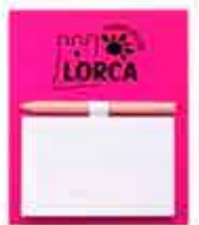
IMÁN LIBRETA Y LÁPIZ - 3,00 €