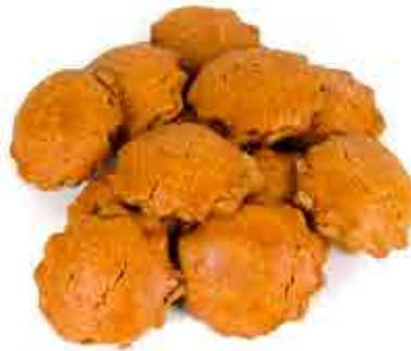
PASTEL DE CABELLO