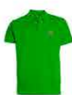
POLO SEÑORA O CABALLERO 15 €