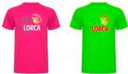
CAMISETA TÉCNICA - 10 €