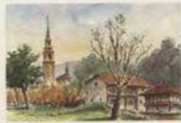
GIJON - UNIVERSIDAD LABORAL