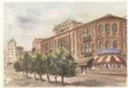
GIJON - TEATRO JOVELLANOS