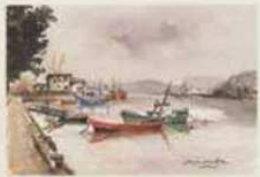
AVILES - RIA