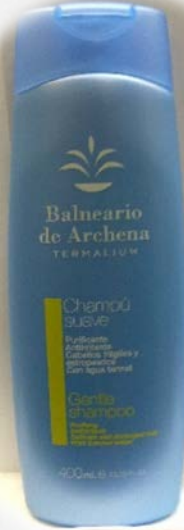
Champú Ref.: B02