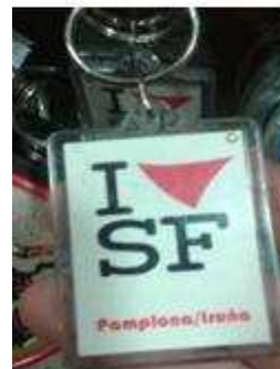
Ref: 016/ 2