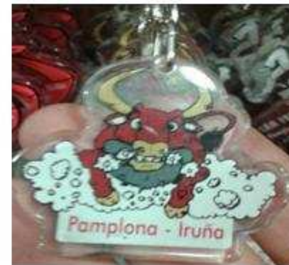
Ref: 016/ 3