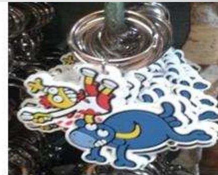
Ref: 016/ 1