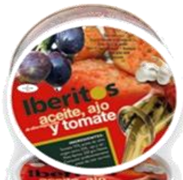
Aceite, ajo y tomate