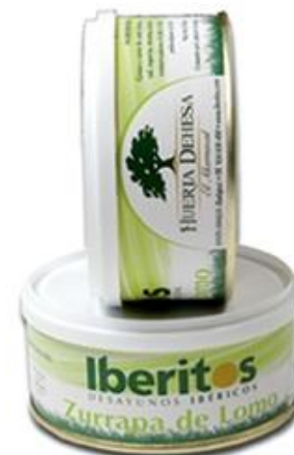
Zurrapa de lomo