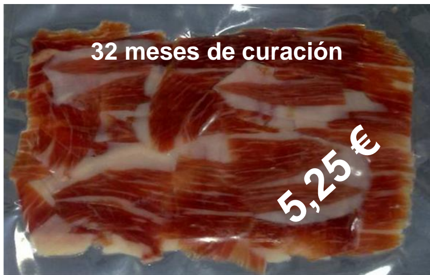
Sobre Jamón Ibérico 100 gr.