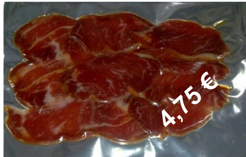
Sobre Lomo Ibérico 100 gr.