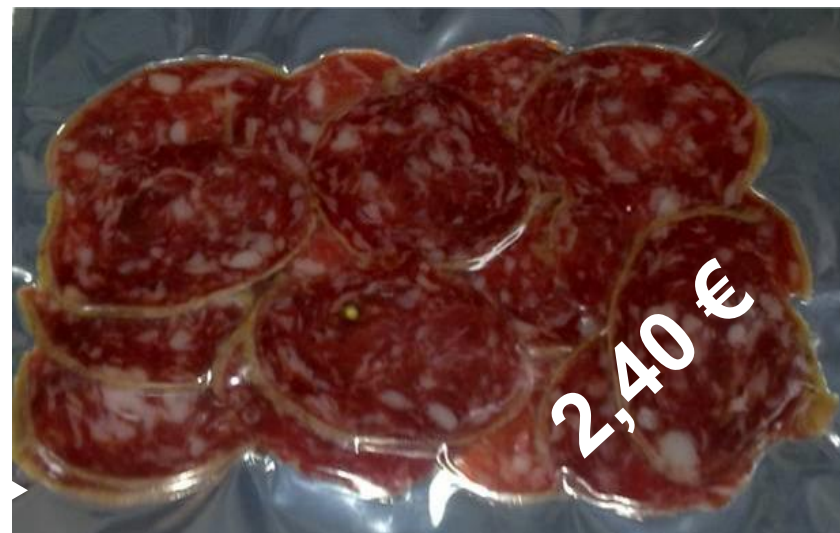
Sobre Salchichón Ibérico 100 gr.