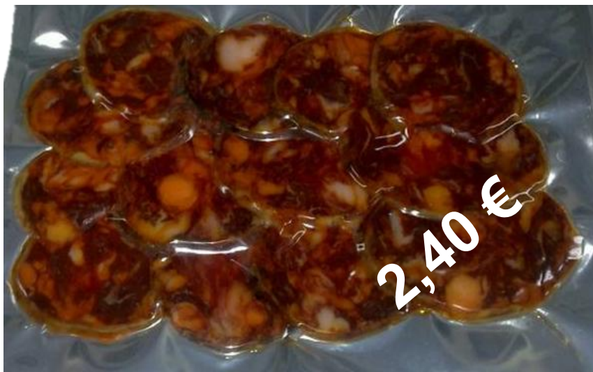
Sobre Chorizo Ibérico 100 gr.