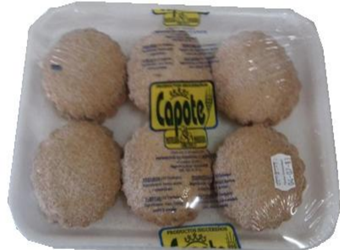
Polvorones de azúcar y canela