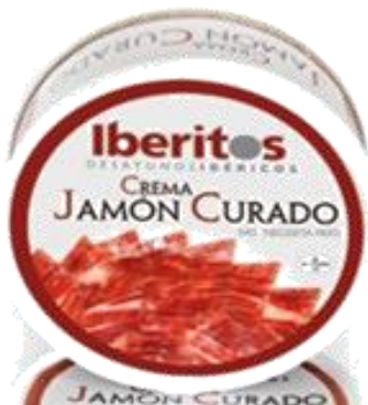
Crema jamón curado