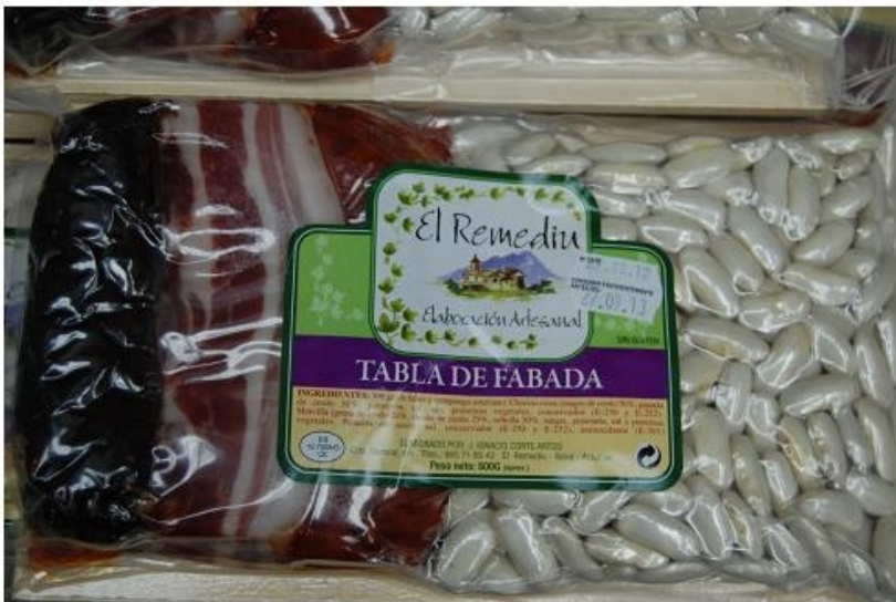
Tabla de Fabada con compango