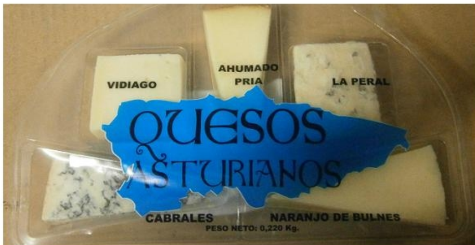
Tabla de Quesos Asturianos