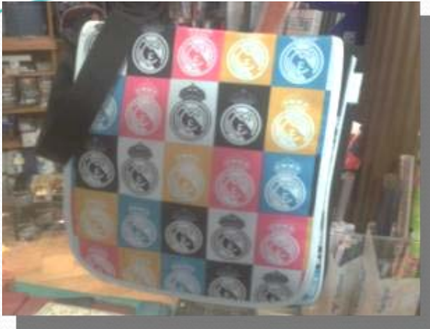
Bandolera Real Madrid