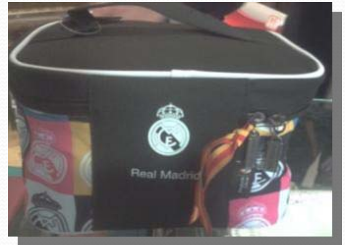
Estuche Real Madrid