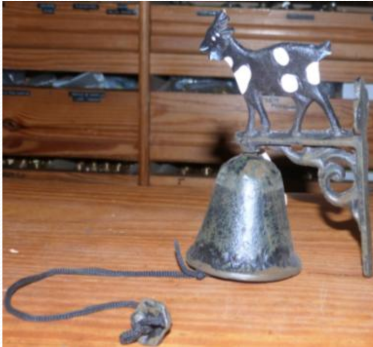
Campana de cabra: Unidad 3,50€.