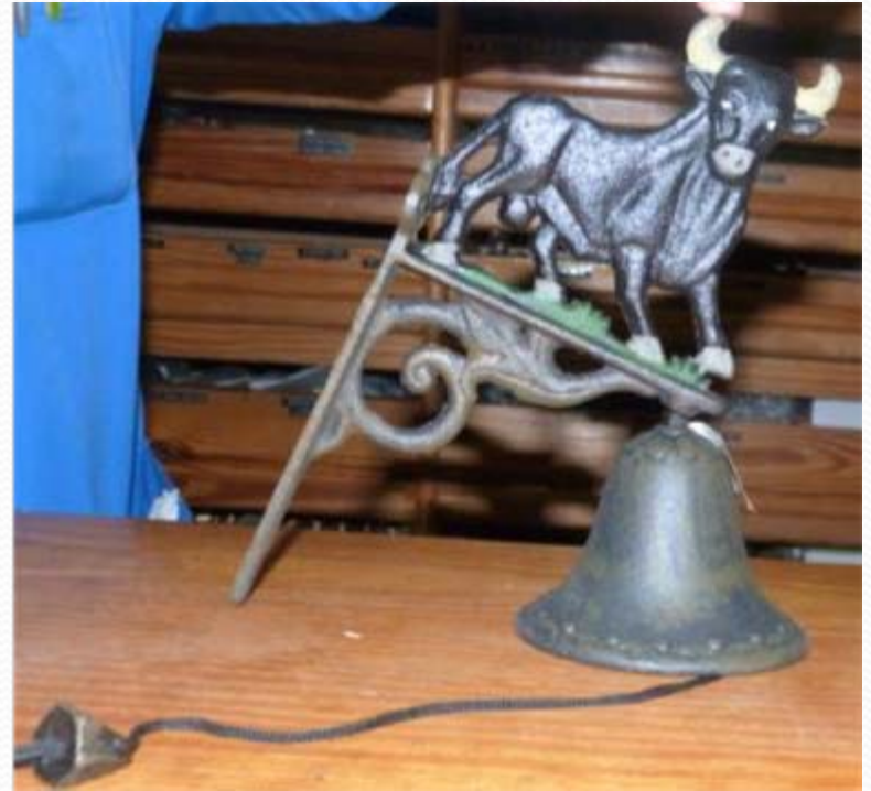
Campana de toro: Unidad 4,50€.