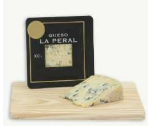
Queso semi-azul la peral