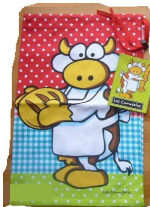
Bolsa del pan