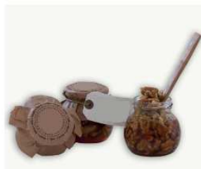
Miel con nueces