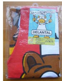
Delantal de cocina