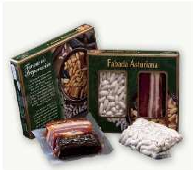
Tabla de preparado para Fabada Asturiana con ingredientes de primera calidad, ideal para dos raciones.

El estuche incluye: fabas, tocino, lacón, chorizo y morcilla, y la receta de la auténtica Fabada Asturiana.