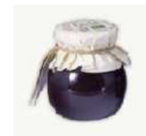
Mermelada de arándanos