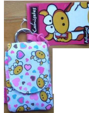
Funda para el móvil