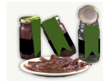
Filetes de anchoas