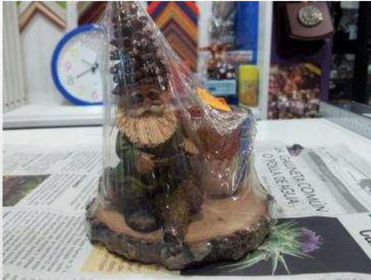
GNOMO DE LOS BOSQUES 4,50€