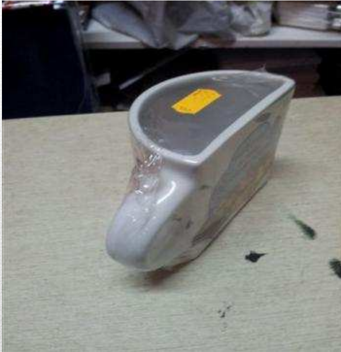
TIRACHINAS Precio: 3€