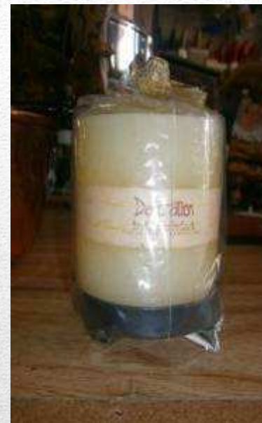
VELA PERFUMADA 3,60€