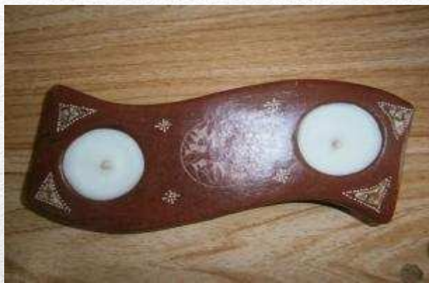
REPOSA VELAS 4,80€