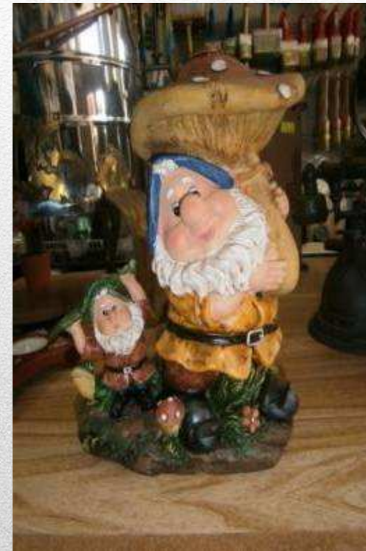
GNOMO ASPERSOR 16,80€