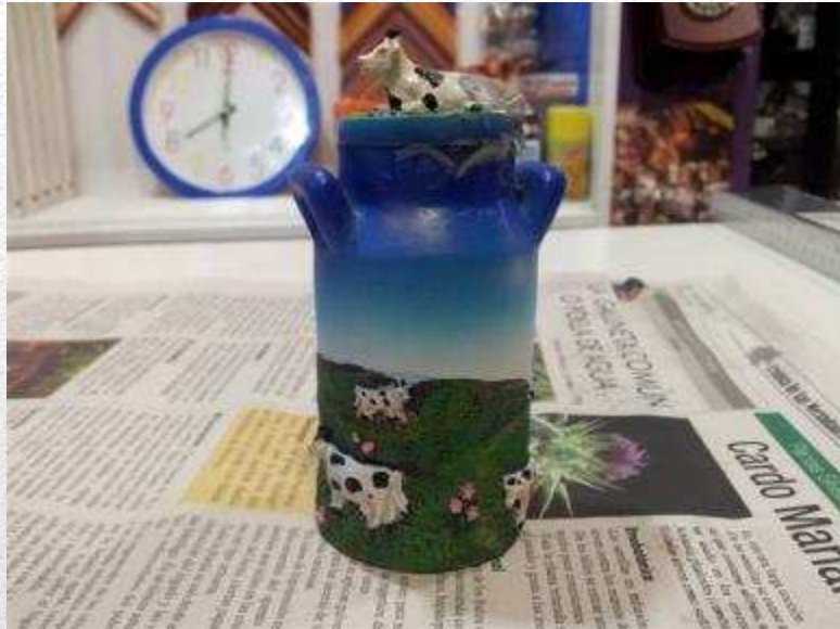
LECHERA DE ADORNO 3,20€