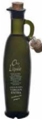
_Aceitera aceite oliva virgen extra