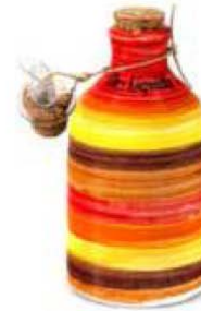
_Envase cerámica vinagre de vino