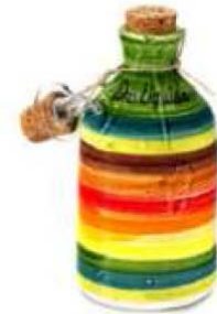
_Envase cerámica aceite de oliva virgen extra