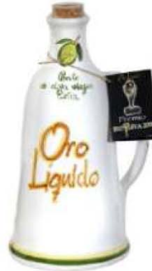
_Envase cerámica aceite de oliva virgen extra

Oro líquido es la mejor definición de la calidad de nuestros aceites y vinagres.