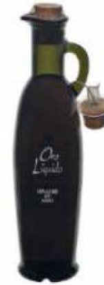
_Vinagrera vinagre de vino