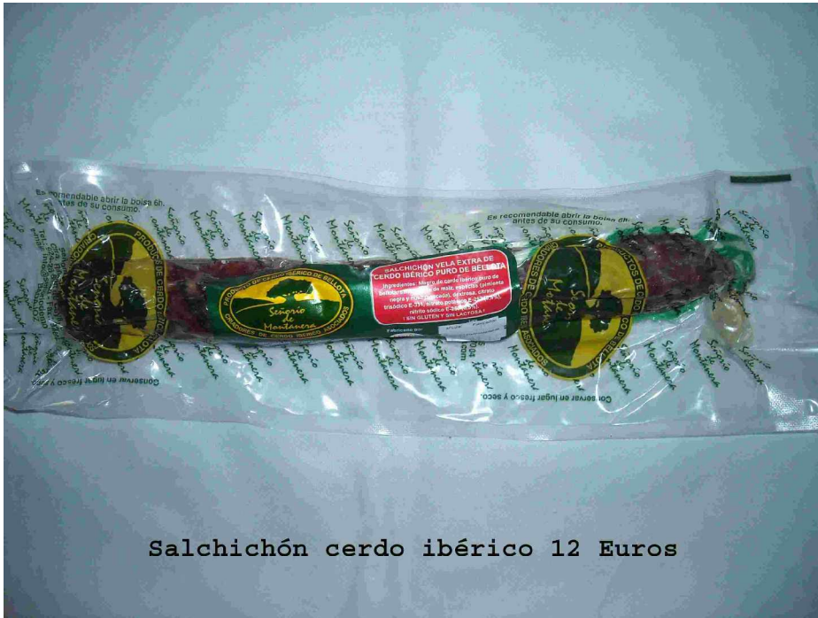
Salchichón cerdo ibérico 12 Euros