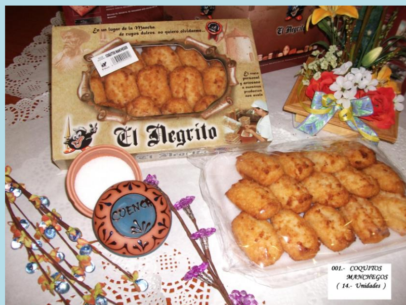
001.- COQUITOS MANCHEGOS ( 14.- Unidades )