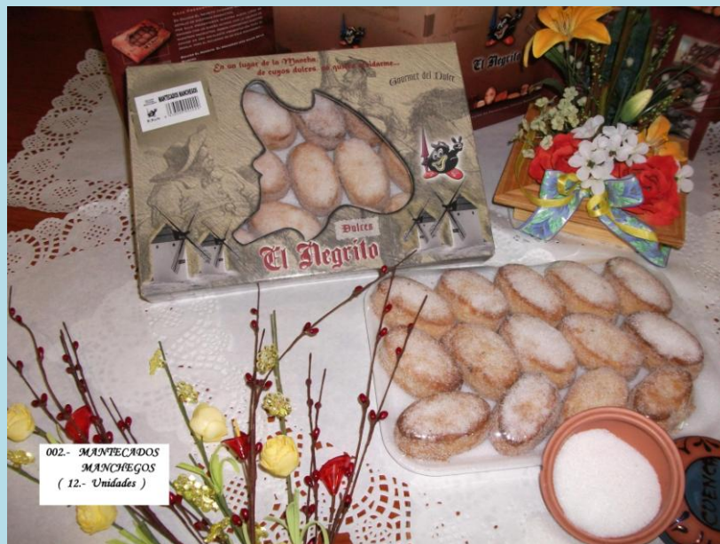
002.- MANTECADOS MANCHEGOS ( 12.- Unidades )