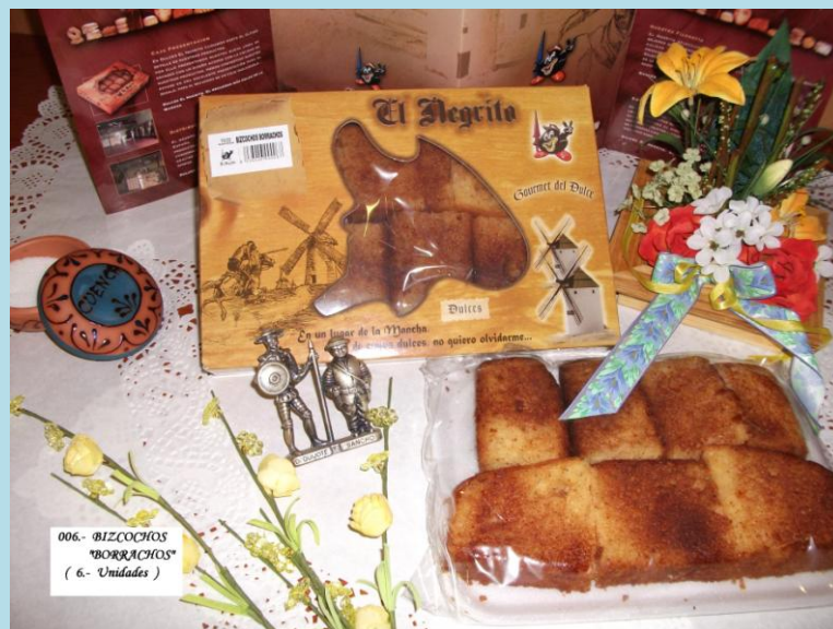
006.- BIZCOCHOS "BORRACHOS" ( 6.- Unidades )