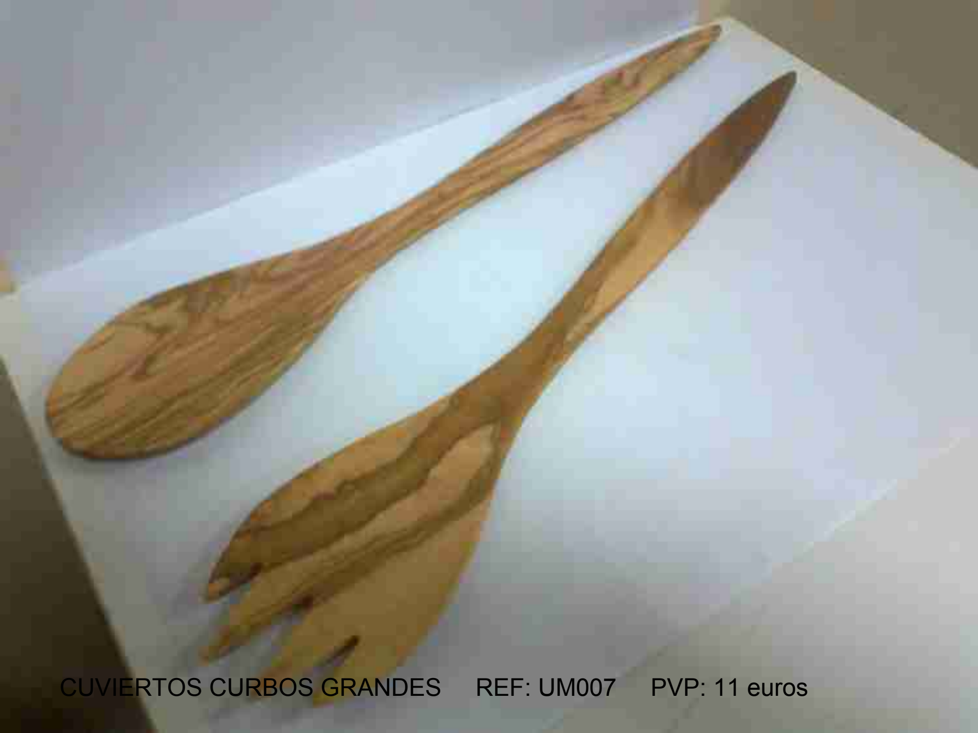
CUVIERTOS CURBOS GRANDES REF: UM007 PVP: 11 euros