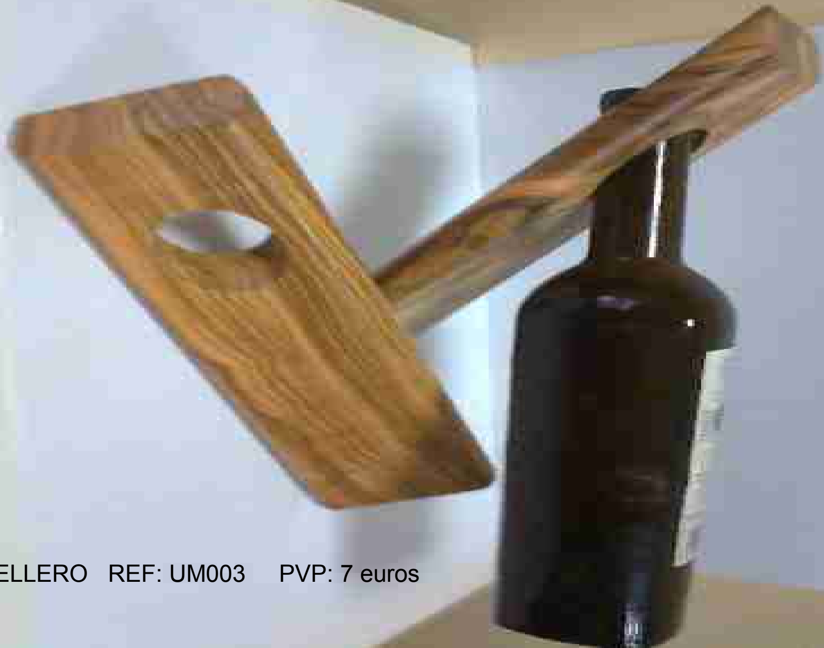
BOTELLERO REF: UM003 PVP: 7 euros