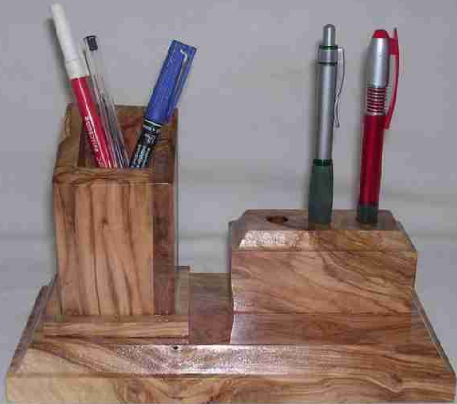
ESCRITORIO REF: UM009 PVP: 16 euros