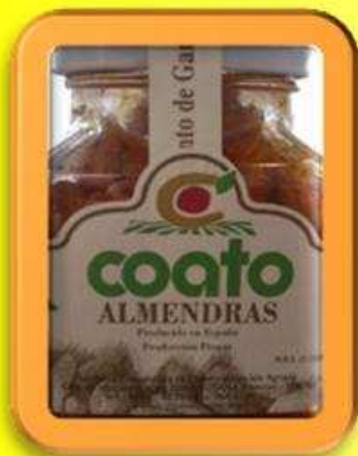
[MH CO AL01]