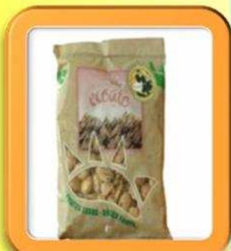
[MH CO AL02]