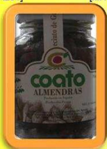
[MH CO AL03]