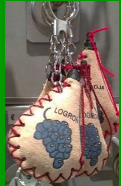
Llaveros Bota de vino Precio: 4€