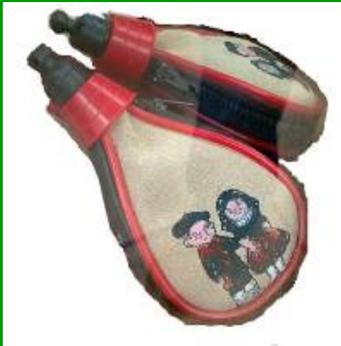
Monederos Bota de vino Precio: 3,50€