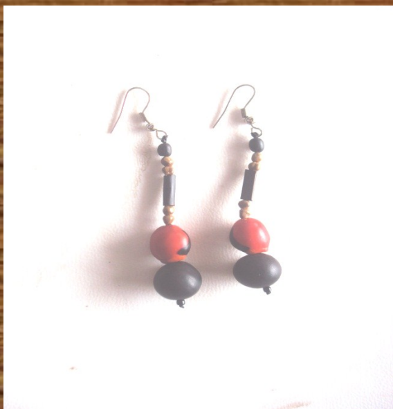
Aretes " cabernight"

DESCRIPCION: Este diseño es muy deslumbrantes y se lo puede utilizar en momentos especiales y combinar con toda clases de vestimenta.