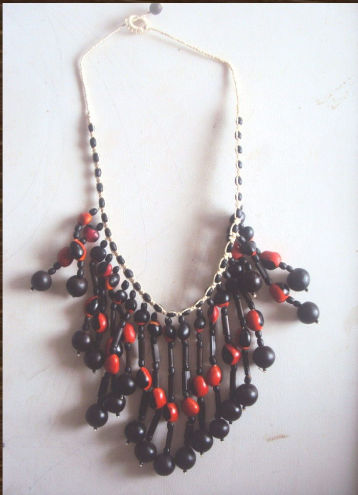
Collares "sisa tamia"

DESCRIPCION: Este diseño es el más conocido por llevar las pepas más coloridas de la región y su selva oscura .