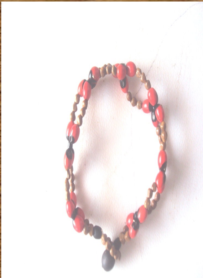
Manillas "selva libre"

DESCRIPCION: Este diseño es el más conocido por llevar las pepas de la zona y con colores que son bien expresan a la naturaleza.