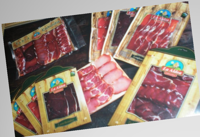
TABLA DE EMBUTIDO 400